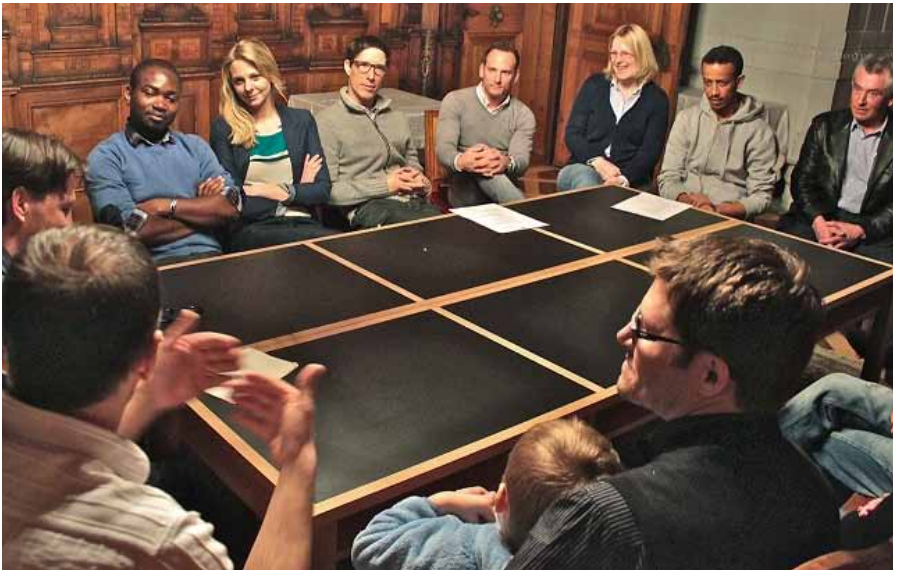
Austausch zu «Engagement im Sport»