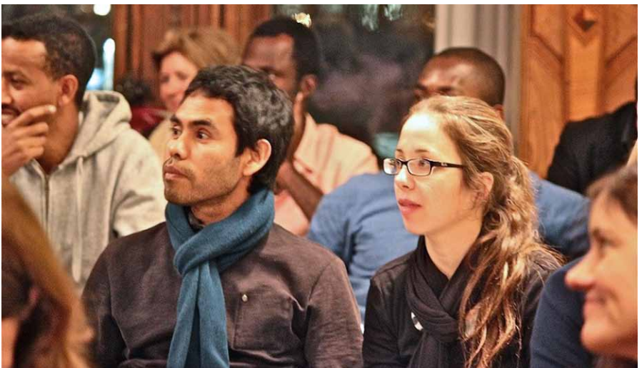
Begrüssung der Personen mit Niederlassungsbewilligung C.

Grundsätzlich will die Stadt Luzern mit ihrem Projekt Impulse setzen, um die Ressourcen und Potenziale von länger ansässigen Migrantinnen und Migranten zu nutzen und eigenverantwortliches Mitwirken anzuregen. Im Fokus stehen dabei die neu niedergelassenen Personen, die den C-Ausweis erhalten haben. Ziel dieses offiziellen Anlasses ist es, dass politisch und gesellschaftlich interessierte Migrantinnen und Migranten ihr Wissen um die Mitverantwortung und Teilhabe erweitern können und eine Möglichkeit zum Austausch erhalten.