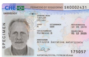
AA19 Residence Permit

I dati biometrici rilevati in centri cantonali sono inoltrati, unitamente ai dati relativi al permesso, da SIMIC alla ditta incaricata di produrre le carte di soggiorno in formato carta di credito e di inviarle direttamente ai destinatari.